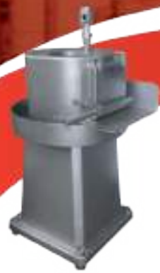
⚙️ LAVADORA DE LENGUAS PLATO Ø 425