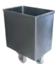
CARRO TIPO BATEA DE 200 LTS