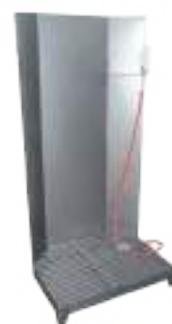
LAVADELANTAL DE PIE