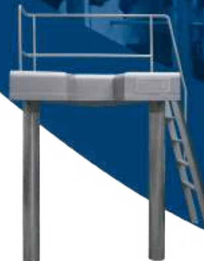
PALCO DE EVISCERADO