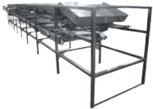
⚙️ NORIA DE VISCERAS