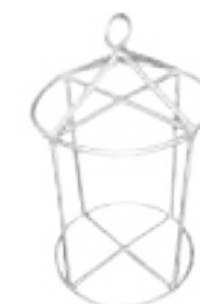
PERCHA PARA ROLDANAS