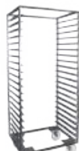
CARRO PORTA BANDEJAS