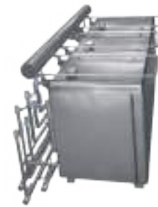
⚙️ COCINA DE MONDONGOS TRIPLE