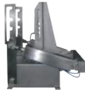
⚙️ ABRIDOR DE QUIJADAS NEUMÁTICO