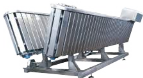
RESTRAINER ANIMALES MENORES