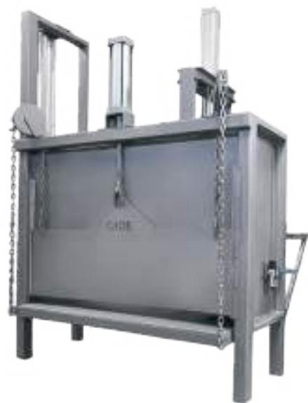
CAJÓN DE NOQUEO NEUMÁTICO