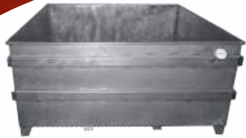
⚙️ BATEA DE ESCALDADO