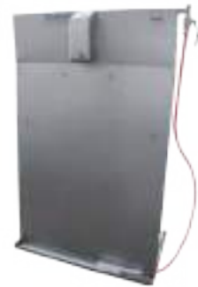
LAVADELANTAL DE PARED