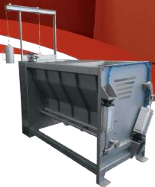
CAJÓN DE NOQUEO DE MADRES