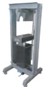
⚙️ HACHADORA DE CABEZAS NEUMÁTICA