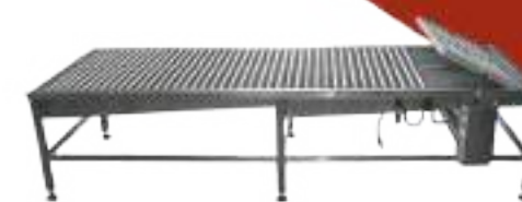
MESA DE SANGRADO DE ROLOS