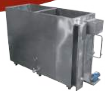
⚙️ MARMITA PARA COCCIÓN