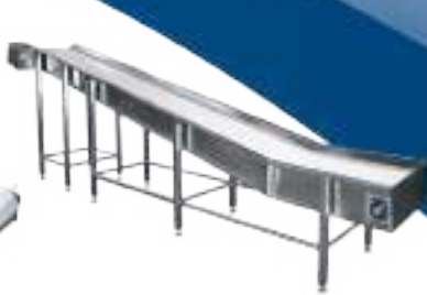
CINTA TRANSPORTADORA CURVA