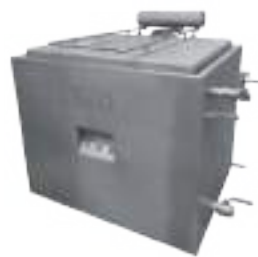
⚙️ COCINA DE MONDONGOS SIMPLE