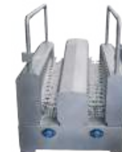
LAVASUELAS Y BOTAS DE PASO OBLIGADO