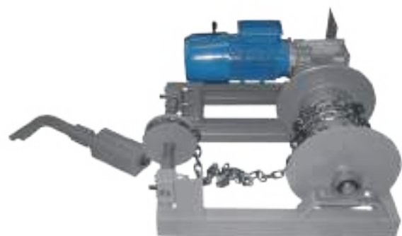
GUINCHE DE IZAJE PORCINO