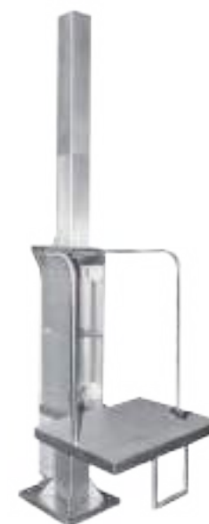
PLATAFORMAS NEUMÁTICA SIMPLE PARA DIVIDIR SIN NORIA