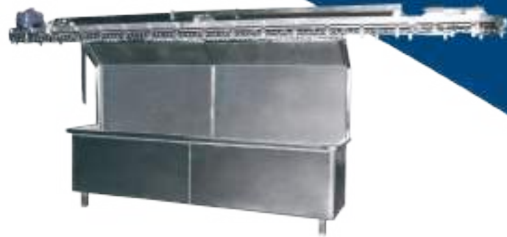
⚙️ NORIA PARA TRANSPORTE DE CABEZAS CON GABINETE DE LAVADO