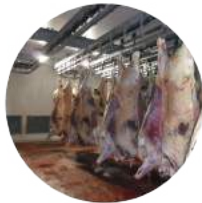
⚙️ NORIAS DE OREO