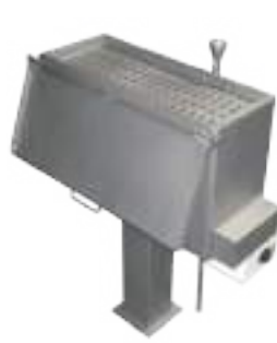
ESTERILIZADOR 40 CUCHILLOS Y CHAIRAS ELÉCTRICO