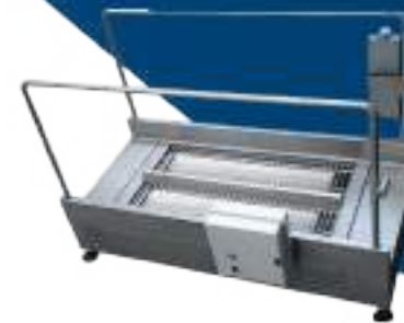
LAVASUELAS DE PASO OBLIGADO