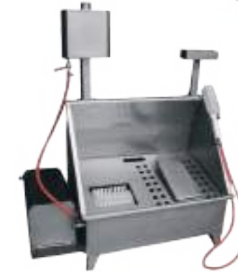
LAVASUELAS Y BOTAS COMBINADO SIMPLE