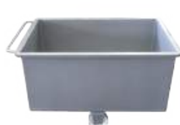
CARRO TIPO BATEA DE 300 LTS