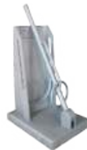
⚙️ ABRIDOR DE QUIJADAS MANUAL