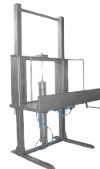
PLATAFORMAS NEUMÁTICA DOBLE PARA DIVIDIR CON NORIA