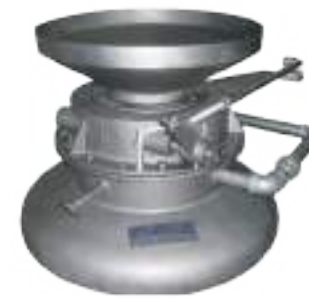
⚙️ SOPLADOR DE MUCANGA