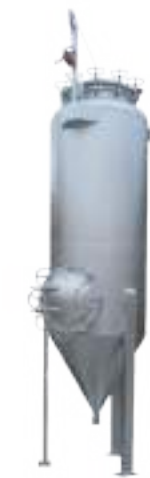
⚙️ DIGESTOR 3000 LTS