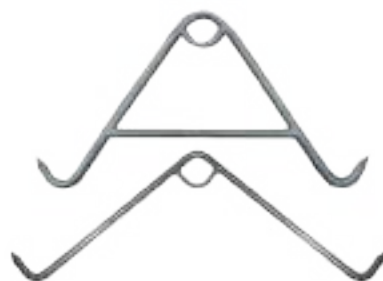
PERCHAS PARA FAENA DE CERDOS