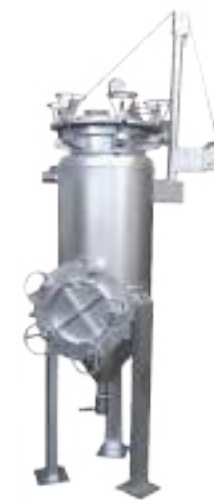
⚙️ DIGESTOR 300 - 500 LTS