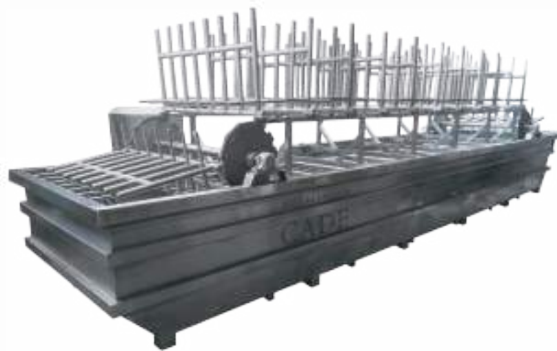
⚙️ ESCALDADOR MECANIZADO