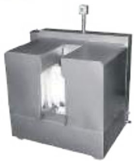
LAVASUELAS Y BOTAS COMBINADO TOTALMENTE MECÁNICO