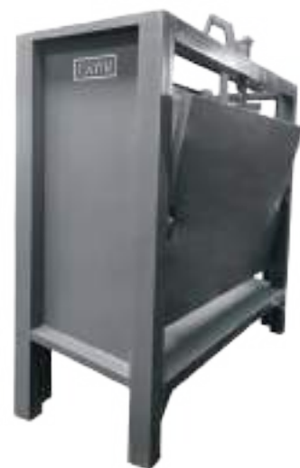
CAJÓN DE NOQUEO MANUAL