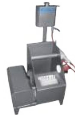
LAVASUELAS Y BOTAS COMBINADO SIMPLE CON CAÑO APOYA PIE