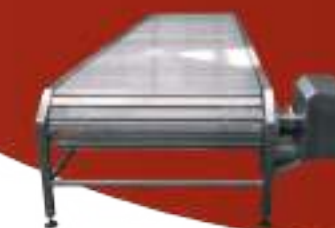
MESA DE SANGRADO MECANIZADA