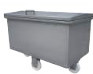
CARRO TIPO BATEA PARA DECOMISO