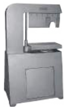
⚙️ HACHADORA DE CABEZAS HIDRÁULICA