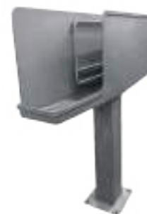
ESTERILIZADOR PARA SIERRA DE DIVIDIR SIN FIN