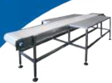
CINTA TRANSPORTADORA CON PUESTOS DE TRABAJO