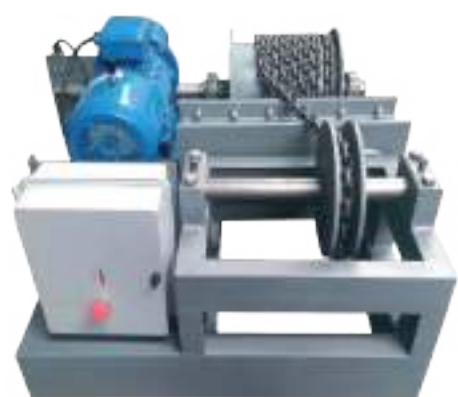
GUINCHE DE IZAJE BOVINO