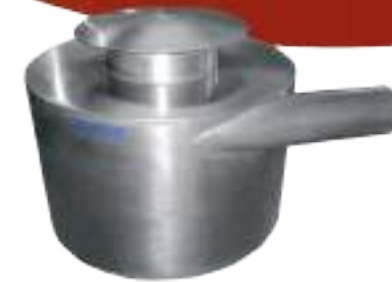
⚙️ CICLÓN RECEPTOR DE SOPLADOR