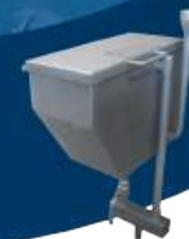
ESTERILIZADOR PARA SIERRA DE CUARTEO CON TAPA