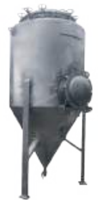
⚙️ DIGESTOR 5000 LTS