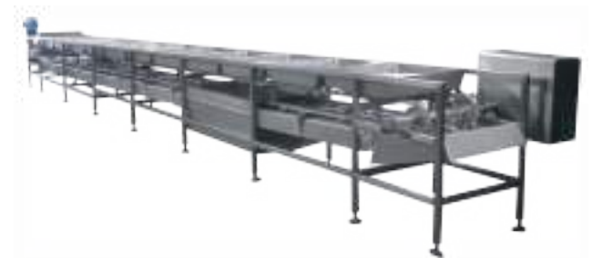
⚙️ NORIA DE VÍSCERAS