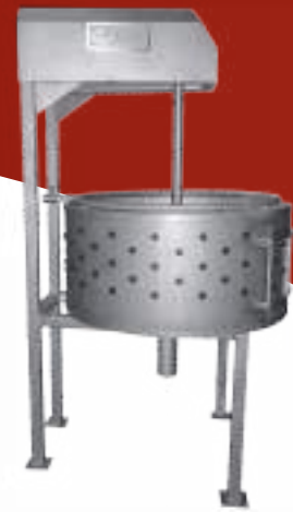
⚙️ PELADORA DE LECHONES