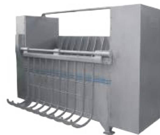
PELADORA PC 60