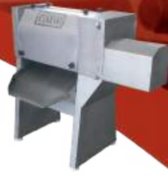
⚙️ DESARRADORA DE TRIPAS