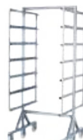
CARRO PARA SECADO DE SALAMINES