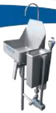
LAVAMANOS SIMPLE CON ESTERILIZADOR ELÉCTRICO