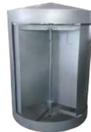
⚙️ GABINETE PARA LAVADO DE CABEZAS GIRATORIO