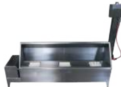
LAVASUELAS TRIPLE MECÁNICO CON TABLERO ELÉCTRICO