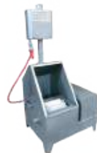
LAVASUELAS SIMPLE MECÁNICO