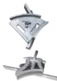
CAMBIOS DE RIELES AÉREOS