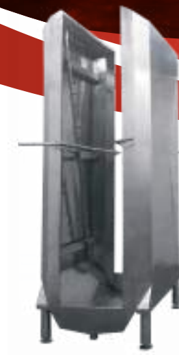
⚙️ CABINA DE LAVADO DE MEDIAS RESES