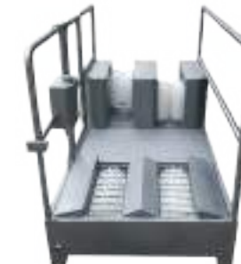
LAVASUELAS Y BOTAS DE PASO OBLIGADO