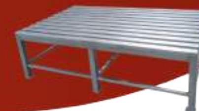
MESA DE REPASO