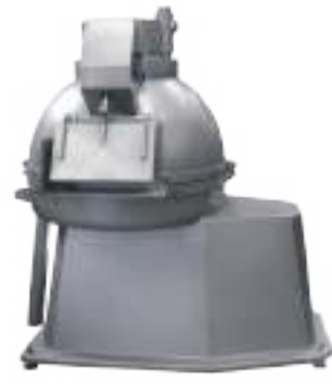
⚙️ LAVADORA DE MONDONGOS Y/O LIBRILLOS PLATO Ø 1100