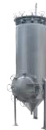
⚙️ DIGESTOR 1500 LTS