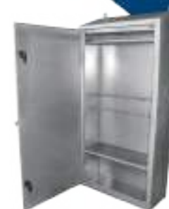
ESTERILIZADOR CON LUZ UV