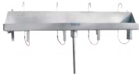
LAVAMANOS CUÁDRUPLE DE ACCIONAMIENTO A RODILLERA