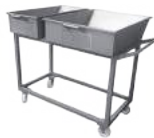
⚙️ ZORRA DE VÍSCERAS