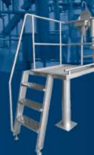
PALCO DE TRABAJO