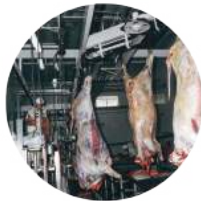
⚙️ NORIAS PARA FAENA