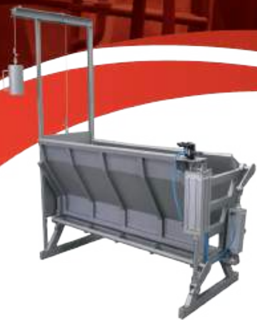
CAJÓN DE NOQUEO DE CERDOS