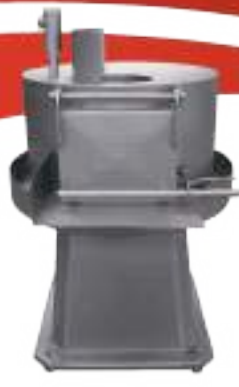
⚙️ LAVADORA DE LENGUAS PLATO Ø 800