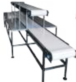
CINTA TRANSPORTADORA CON PUESTOS DE TRABAJO