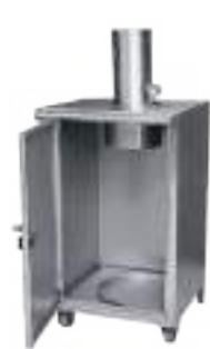
ESTERILIZADOR PORTÁTIL A GARRAFA