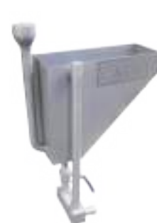
ESTERILIZADOR PARA SIERRA DE PECHO DOBLE