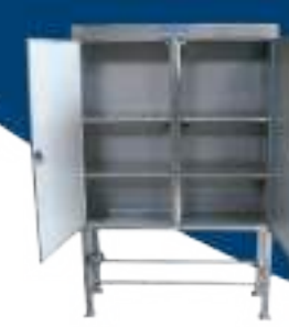
ESTERILIZADOR 120 CUCHILLOS Y CHAIRAS ELÉCTRICO