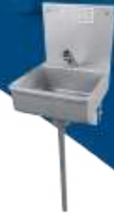
LAVAMANOS SIMPLE DE ACCIONAMIENTO AUTOMÁTICO