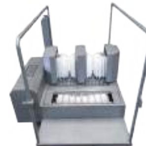
LAVASUELAS Y BOTAS DE PASO OBLIGADO