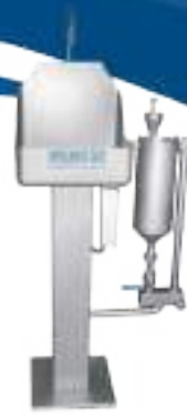
LAVAMANOS SIMPLE CON PEDESTAL Y ESTERILIZADOR