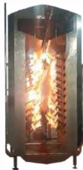
⚙️ FLAMEADOR DE CERDOS