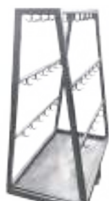
CARRO CON GANCHERA