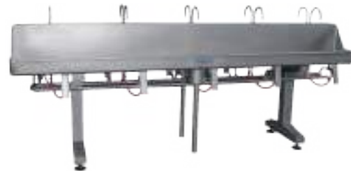
LAVAMANOS DE CINCO PUESTOS DE CADA LADO