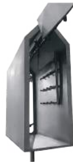
⚙️ GABINETE PARA LAVADO DE CABEZAS