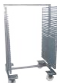
CARRO PARA JERKY BEEF