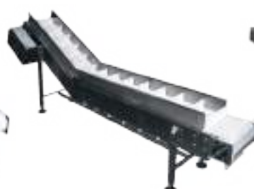
CINTA TRANSPORTADORA INCLINADA