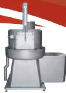
⚙️ REFINADORA DE MONDONGOS PLATO Ø 650 Ø 900 Ø 1100