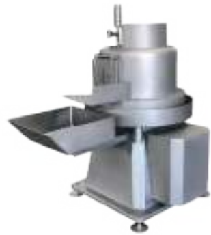
⚙️ LAVADORA DE MONDONGOS Y/O LIBRILLOS PLATO Ø 650