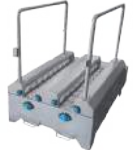
LAVASUELAS Y BOTAS BAJAS DE PASO OBLIGADO