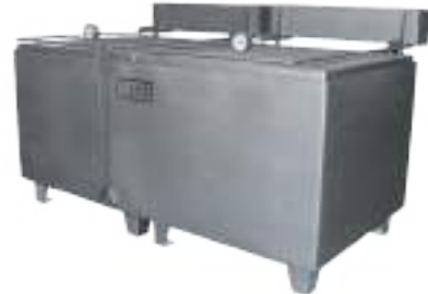
⚙️ COCINA DE MONDONGOS DOBLE