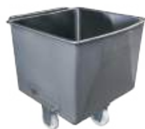
CARRO NORMALIZADO TIPO BATEA DE 200 LTS