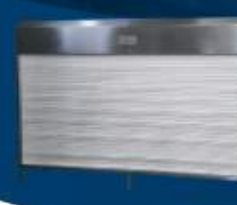
ESTERILIZADOR POR OZONO