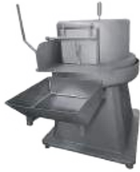
⚙️ LAVADORA DE MONDONGOS Y/O LIBRILLOS PLATO Ø 900