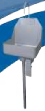
LAVAMANOS SIMPLE DE ACCIONAMIENTO A RODILLERA