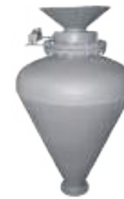
⚙️ SOPLADOR DE HUESOS MOLIDOS