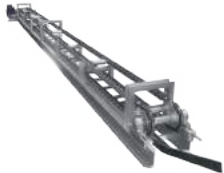
⚙️ NORIA DE ASCENSO/DESCENSO