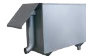
ESTERILIZADOR DE GANCHOS NORIA DE CABEZAS