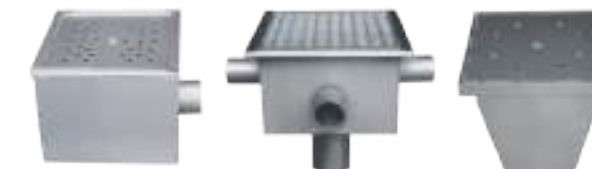
REJILLAS DE DESAGÜE SIFONADO