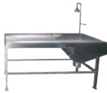
⚙️ MESA PARA VACIADO Y LAVADO DE LIBRILLOS