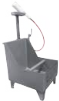
LAVABOTAS SIMPLE TIPO BATEA