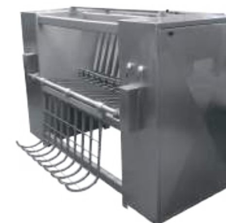
PELADORA PC 120