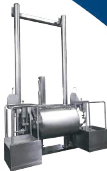
DESCUEREADORA A TAMBOR