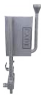
ESTERILIZADOR DE CUCHILLO Y CHAIRA RECTANGULAR