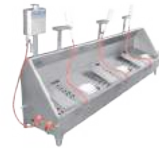
LAVASUELAS Y BOTAS COMBINADO TRIPLE