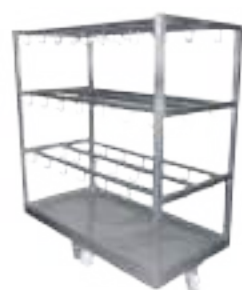
CARRO CON GANCHERA