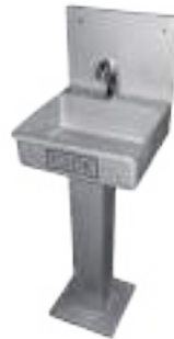
LAVAMANOS SIMPLE DE ACCIONAMIENTO AUTOMÁTICO CON PEDESTAL