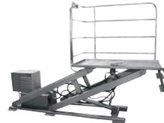
PLATAFORMAS PARA ASERRADO TIPO TIJERA