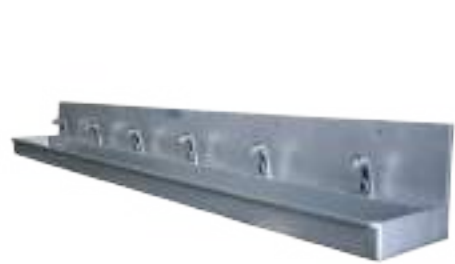
LAVAMANOS SÉXTUPLE DE ACCIONAMIENTO AUTOMÁTICO